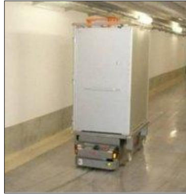
Figure C1-1 – Quelques vues des dispositifs A.G.V.

▼ A.G.V. avec armoire chariot en mouvement